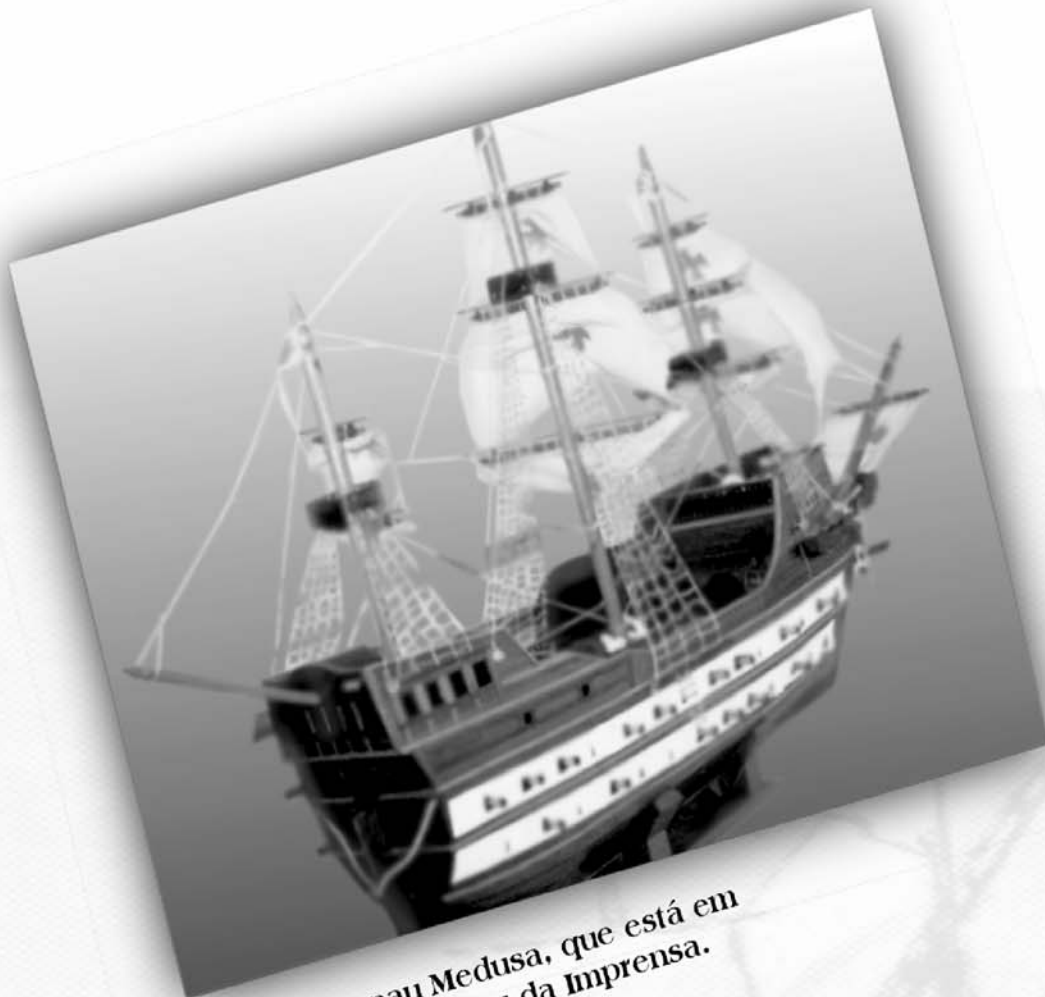
Réplica da nau Medusa, que está em exposição no Museu da Imprensa.

...os primeiros prelos da Imprensa Régia vieram nos porões da nau Medusa, quando da transferência da Corte Portuguesa para o Brasil, trazendo à colônia inestimáveis benefícios, dentre os quais, a criação de uma Imprensa Oficial?