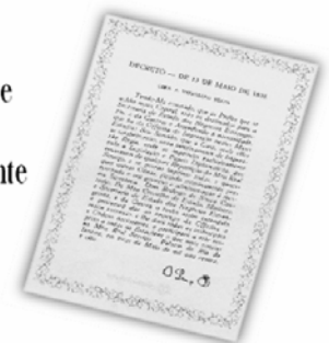
Replica do Decreto de 13 de maio de 1808.

...a Imprensa Nacional foi criada através do Decreto de 13 de maio de 1808, assinado pelo Príncipe Regente D. João, com o nome de Impressão Régia e seu objetivo era o de imprimir, com exclusividade, todos os atos normativos e administrativos oficiais do governo?