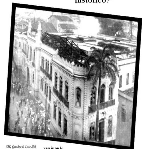
SIG, Quadra 6, Lote 800, Brasília - DF CEP 70610-460 www.in.gov.br ouvidoria@in.gov.br

...após a Imprensa Nacional ter várias sedes provisórias, foi inaugurado, por D. Pedro II, em 1877, o primeiro prédio construído para abrigar os prelos e todo o material usado na gráfica? Que este edifício pegou fogo na noite de 15 de setembro de 1911, onde se perdeu vasto material histórico?