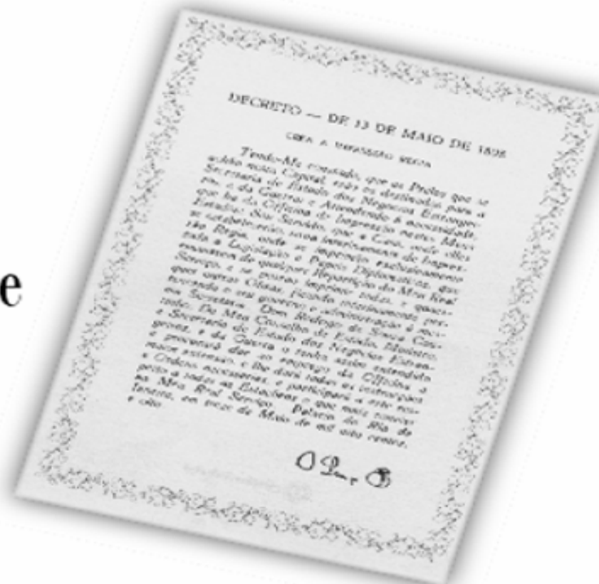
Réplica do Decreto de 13 de maio de 1808.

...a Imprensa Nacional foi criada através do Decreto de 13 de maio de 1808, assinado pelo Príncipe Regente D. João, com o nome de Impressão Régia e seu objetivo era o de imprimir, com exclusividade, todos os atos normativos e administrativos oficiais do governo?