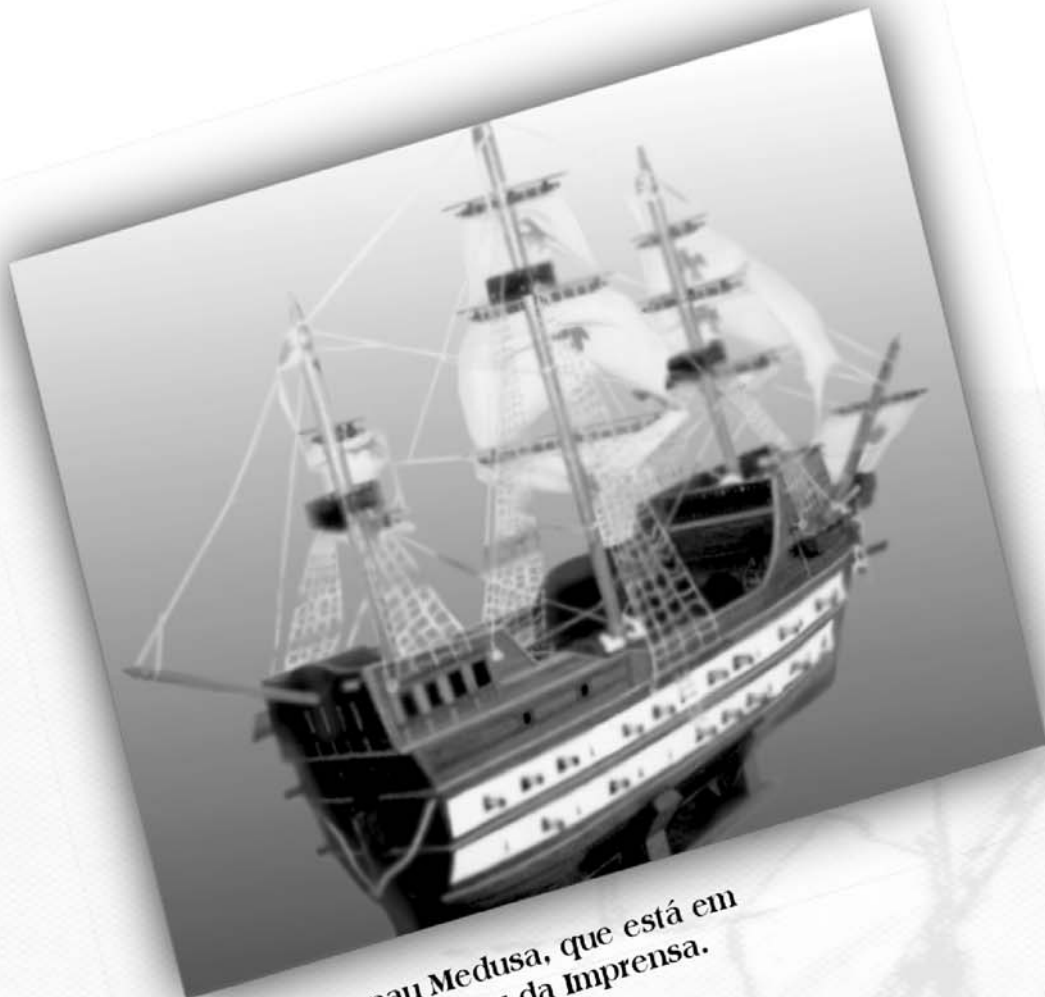
Réplica da nau Medusa, que está em exposição no Museu da Imprensa.

...os primeiros prelos da Imprensa Régia vieram nos porões da nau Medusa, quando da transferência da Corte Portuguesa para o Brasil, trazendo à colônia inestimáveis benefícios, dentre os quais, a criação de uma Imprensa Oficial?