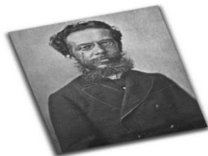
O autor de "Dom Casmurro", "Quincas Borba", entre outras obras, é patrono in memoriam da Imprensa Nacional desde janeiro de 1997.