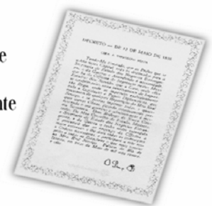
Replica do Decreto de 13 de maio de 1808.

...a Imprensa Nacional foi criada através do Decreto de 13 de maio de 1808, assinado pelo Príncipe Regente D. João, com o nome de Impressão Régia e seu objetivo era o de imprimir, com exclusividade, todos os atos normativos e administrativos oficiais do governo?