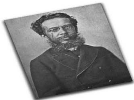
O autor de "Dom Casmurro", "Quincas Borba", entre outras obras, é patrono in memoriam da Imprensa Nacional desde janeiro de 1997.

a)Processo: TC- 045.857/2012-1; b)Espécie: 5º TA ao CT nº 17/2009, firmado em 4/6/2013, entre o TCU e a empresa Smaff Automóveis Ltda; c)Objeto: prorrogação da vigência até 29/6/2014; d)Fundamento Legal: artigo 57, inciso II, da Lei nº 8.666/93; e)Elemento Orçamentário: 3.3.90.39 da atividade nº 01.032.0550.4018.0001; f)Valor: R$ 56.237,42 sendo R$ 28.274,93 para 2013; g)NE nº 2013NE0000771 de 13/5/2013; h)Signatários: pelo Contratante, Ary Fernando Beirão, e, pelo Contratado, Marco Antônio de Faria Costa.