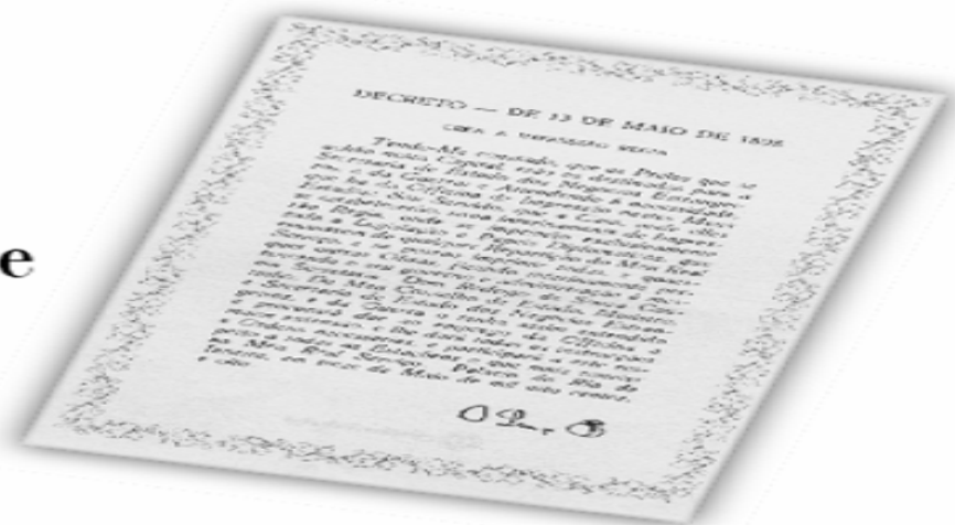
Réplica do Decreto de 13 de maio de 1808.

...a Imprensa Nacional foi criada através do Decreto de 13 de maio de 1808, assinado pelo Príncipe Regente D. João, com o nome de Impressão Régia e seu objetivo era o de imprimir, com exclusividade, todos os atos normativos e administrativos oficiais do governo?