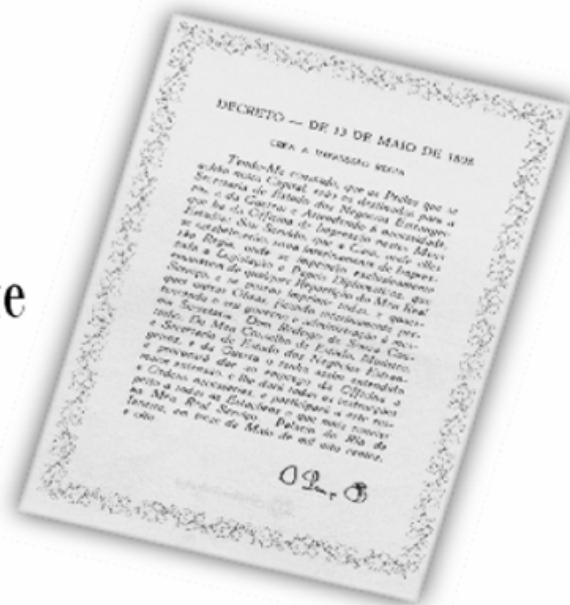
Replica do Decreto de 13 de maio de 1808.

...a Imprensa Nacional foi criada através do Decreto de 13 de maio de 1808, assinado pelo Príncipe Regente D. João, com o nome de Impressão Régia e seu objetivo era o de imprimir, com exclusividade, todos os atos normativos e administrativos oficiais do governo?