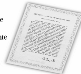
Replica do Decreto de 13 de maio de 1808.

...a Imprensa Nacional foi criada através do Decreto de 13 de maio de 1808, assinado pelo Príncipe Regente D. João, com o nome de Impressão Régia e seu objetivo era o de imprimir, com exclusividade, todos os atos normativos e administrativos oficiais do governo?