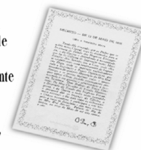
Replica do Decreto de 13 de maio de 1808.

...a Imprensa Nacional foi criada através do Decreto de 13 de maio de 1808, assinado pelo Príncipe Regente D. João, com o nome de Imprensa Régia e seu objetivo era o de imprimir, com exclusividade, todos os atos normativos e administrativos oficiais do governo?