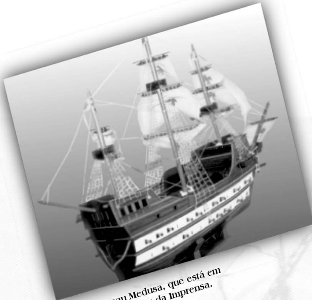
Réplica da nau Medusa, que está em exposição no Museu da Imprensa.

...os primeiros prelos da Imprensa Régia vieram nos porões da nau Medusa, quando da transferência da Corte Portuguesa para o Brasil, trazendo à colônia inestimáveis benefícios, dentre os quais, a criação de uma Imprensa Oficial?