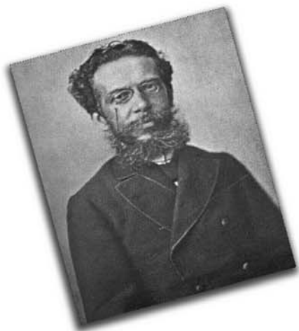
O autor de "Dom Casmurro", "Quincas Borba", entre outras obras, é patrono in memoriam da Imprensa Nacional desde janeiro de 1997.

VIII. Fabiana Carvalho de Oliveira (Secretaria de Fomento e Incentivo a Cultura) - Suplente