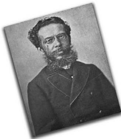
O autor de "Dom Casmurro", "Quincas Borba", entre outras obras, é patrono in memoriam da Imprensa Nacional desde janeiro de 1997.