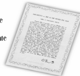
Replica do Decreto de 13 de maio de 1808.

...a Imprensa Nacional foi criada através do Decreto de 13 de maio de 1808, assinado pelo Príncipe Regente D. João, com o nome de Impressão Régia e seu objetivo era o de imprimir, com exclusividade, todos os atos normativos e administrativos oficiais do governo?