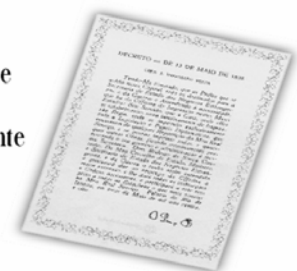
Replica do Decreto de 13 de maio de 1808.

...a Imprensa Nacional foi criada através do Decreto de 13 de maio de 1808, assinado pelo Príncipe Regente D. João, com o nome de Impressão Régia e seu objetivo era o de imprimir, com exclusividade, todos os atos normativos e administrativos oficiais do governo?