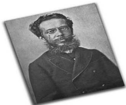
O autor de "Dom Casmurro", "Quincas Borba", entre outras obras, é patrono in memoriam da Imprensa Nacional desde janeiro de 1997.