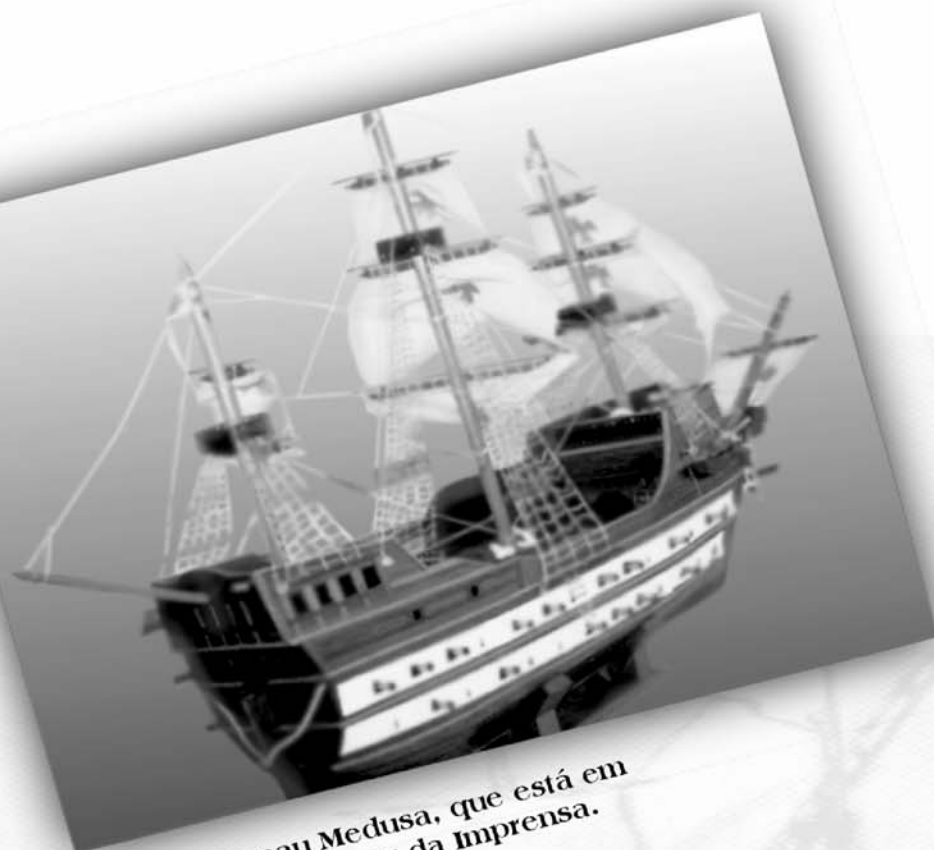
Réplica da nau Medusa, que está em exposição no Museu da Imprensa.

...os primeiros prelos da Imprensa Régia vieram nos porões da nau Medusa, quando da transferência da Corte Portuguesa para o Brasil, trazendo à colônia inestimáveis benefícios, dentre os quais, a criação de uma Imprensa Oficial?