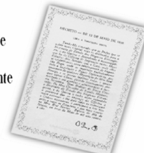
Replicação do Decreto de 13 de maio de 1808.

...a Imprensa Nacional foi criada através do Decreto de 13 de maio de 1808, assinado pelo Príncipe Regente D. João, com o nome de Imprensa Régia e seu objetivo era o de imprimir, com exclusividade, todos os atos normativos e administrativos oficiais do governo?