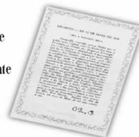
Replicação do Decreto de 13 de maio de 1808.

...a Imprensa Nacional foi criada através do Decreto de 13 de maio de 1808, assinado pelo Príncipe Regente D. João, com o nome de Impressão Régia e seu objetivo era o de imprimir, com exclusividade, todos os atos normativos e administrativos oficiais do governo?