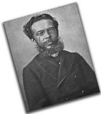
O autor de "Dom Casmurro", "Quincas Borba", entre outras obras, é patrono in memoriam da Imprensa Nacional desde janeiro de 1997.