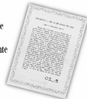
Replica do Decreto de 13 de maio de 1808.

...a Imprensa Nacional foi criada através do Decreto de 13 de maio de 1808, assinado pelo Príncipe Regente D. João, com o nome de Impressão Régia e seu objetivo era o de imprimir, com exclusividade, todos os atos normativos e administrativos oficiais do governo?