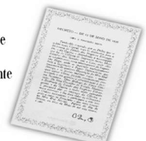
Replica do Decreto de 13 de maio de 1808.

...a Imprensa Nacional foi criada através do Decreto de 13 de maio de 1808, assinado pelo Príncipe Regente D. João, com o nome de Impressão Régia e seu objetivo era o de imprimir, com exclusividade, todos os atos normativos e administrativos oficiais do governo?