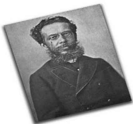
O autor de "Dom Casmurro", "Quincas Borba", entre outras obras, é patrono in memoriam da Imprensa Nacional desde janeiro de 1997.