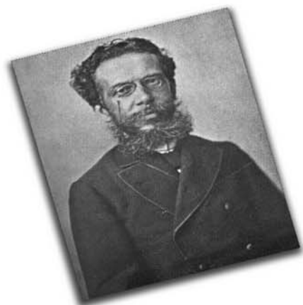
O autor de "Dom Casmurro", "Quincas Borba", entre outras obras, é patrono in memoriam da Imprensa Nacional desde janeiro de 1997.

A CHEFE DA SEÇÃO OPERACIONAL DA GESTÃO DE PESSOAS DA GERÊNCIA EXECUTIVA DO INSS EM CAMPINA GRANDE/PB, no uso das atribuições que lhe foram conferidas pelo artigo 171, inciso III, alínea "b" da Portaria nº 296/MPS, de 09 de novembro de 2009, publicada no DOU nº 214, de 10 de novembro de 2009, considerando a competência de que trata os artigos 10 e 11 da Orientação Normativa MPOG/SEGEP Nº 1, de 10 de janeiro de 2013, resolve: